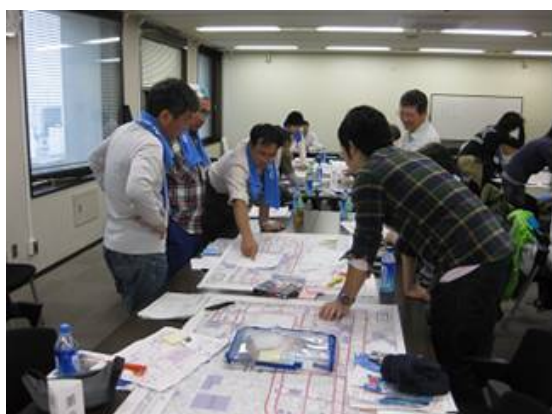
グループミーティングの様子