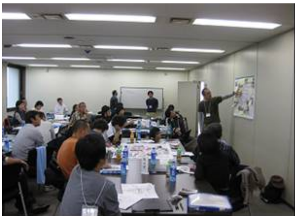
発表の様子と大図